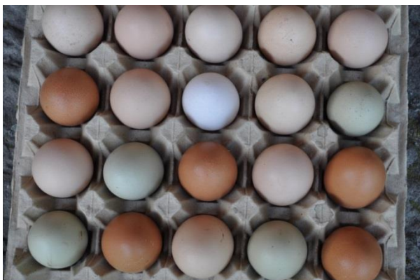
Abbildung 1 - Unterschiedliche Eierschalenfarben aus einem Bestand verschiedener und vermischter Hühnerrassen.

Im weiteren Verlauf der Eibildung wird das Ei durch den Eileiter vorangetrieben und passiert anschließend eine Eileiterenge. Nun bilden sich die innere und äußere Schalenhaut, die Dotter und Eiklar umhüllen. Das Ei schiebt sich weiter in Richtung Uterus und erhält nun seine feste Schale in Form von Kalkablagerungen. Zuvor nimmt das Ei aber noch Wasser auf, so dass sich die Schalenhäute mit der Volumenzunahme glätten. Die Schalenproduktion nimmt 12 bis 14 Stunden in Anspruch. Erst im letzten Drittel dieser Zeit bekommt das Ei seine Farbe. Pigmenteinlagerungen in die Kalkstruktur ergeben den „Bräunungsgrad“ eines Eis. Welche Farbe ein Ei hat, ist rassetypisch, variiert aber von Huhn zu Huhn. Vom pigmentlosen weißen Ei bis zu schokoladenbrauner Eierschale ist das Spektrum breit. Im Bereich der Rassegeflügelzucht gibt es auch Hühnerrassen, die grüne Eier legen und sich dabei zwischen Mint und Olivgrün bewegen, aber auch rötliche und sogar bläuliche Varianten kommen vor. Als Konsumierer werden aber in der Regel weiße und hellbraune Eier bevorzugt. Hühner legen ihr Leben lang in etwa dieselbe Eifarbe.