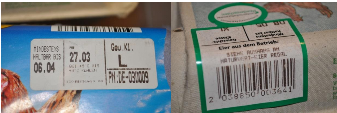
Abbildung 3 a und b - Kennzeichnungen auf Eierverpackungen

Was außerdem noch auf einem Eierkarton stehen muss: Wie viele Eier darin sind und eine Packstellen-Nummer. Die Packstellenummer enthält wie der Erzeugercode ein Länderkürzel, die Ziffern für das Bundesland und eine Betriebsnummer. So kann die Firma identifiziert werden, bei der die Eier sortiert und verpackt wurden. Auch diese Nummern sind EU-weit rückverfolgbar.